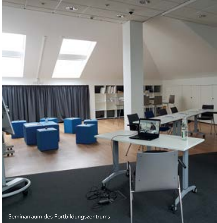
Seminarraum des Fortbildungszentrums